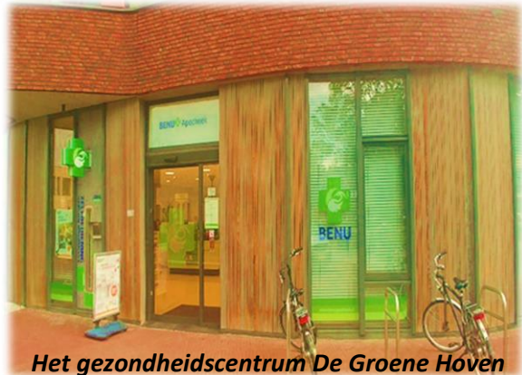
Het gezondheidscentrum De Groene Hoven

Na de lezing heeft een zestal bewoners en bezoekers van de dagbehandeling van De Veenkamp onder leiding van Henri schetsen gemaakt. Ook de werkgroep Dementievriendelijke wijk en de wijkbeheerder van de gemeente Apeldoorn deden mee. De opdracht was: hoe maken we een boodschappenroute, hoe moet het ontwerp op een tegel er uit zien? De symbolen en kleuren op de tegels moeten herkenbaar en goed zichtbaar zijn.